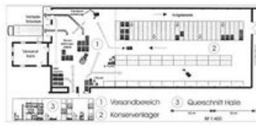
Variante IV: Kombination Paletten- & Durchlaufregal