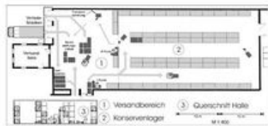
Variante I: Palettenregal (Einplatzsystem)