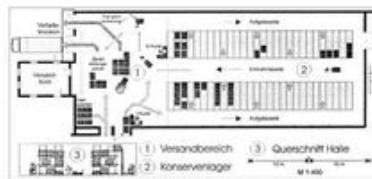
Variante III: Durchlaufregal